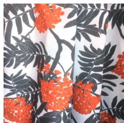
43032/892 Hvit –terra