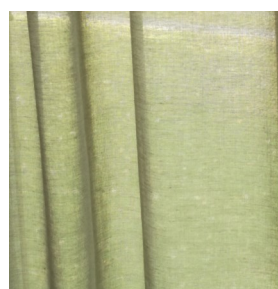
55000/39 Lys oliven