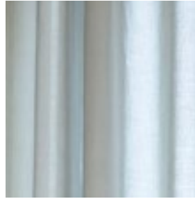
55000/09 Lys grå