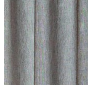
55000/99 Mørk grå