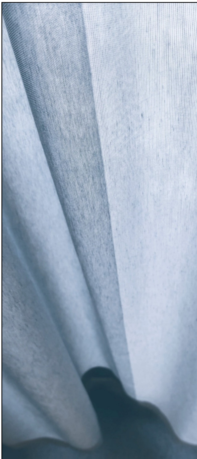
Bildet viser Flo og Fjære som vertikale felt