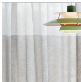
22000/909 Mokka som horisontale felt