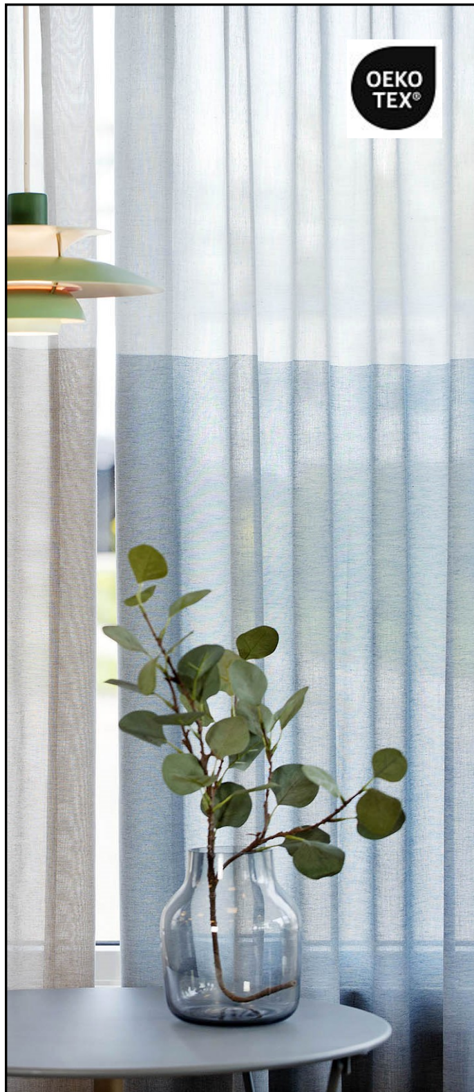
Bildet viser Flo og Fjære som horisontale felt